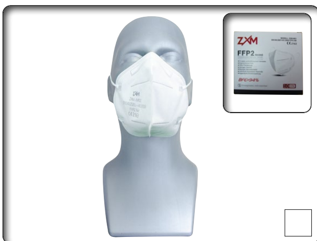
Atemschutzmaske Typ ZXM