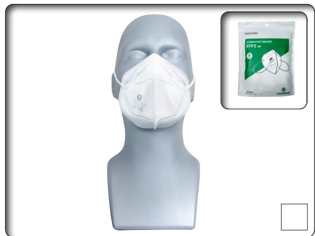
Atemschutzmaske Typ HJR