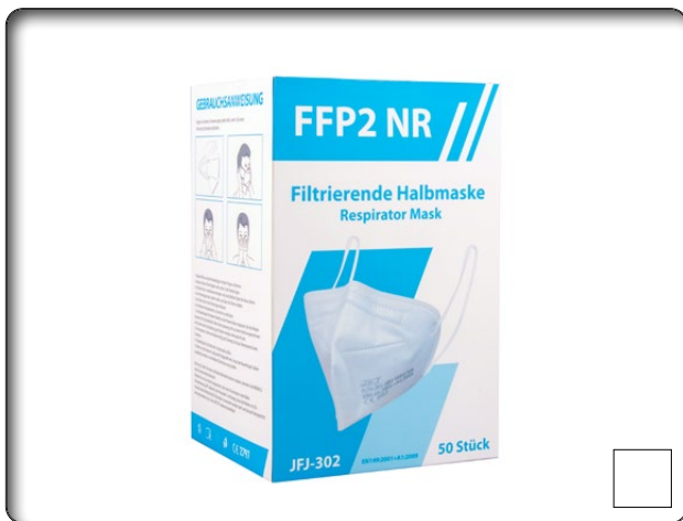
Atemschutzmaske Typ JFJ

VOLLSTÄNDIGE MUND-NASEN-BEDECKUNGEN MIT JUSTIERBAREN NASENBÜGELN FÜR OPTIMALEN SITZ, OHNE VENTIL SCHUTZKLASSE FFP2 NR, EN 149:2001+A1:2009